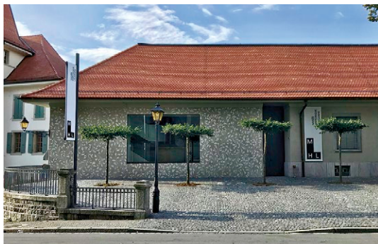
© Brauen Wälchli Architectes, Doris Wälchli