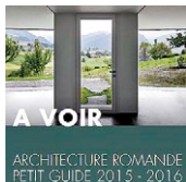
A VOIR ARCHITECTURE ROMANDE PETIT GUIDE 2015 - 2016

Disponible lors des visites, en librairie ou sur commande: info@vd.sia.ch